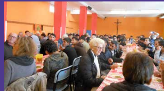
Aviano, Parrocchia San Zenone Vescovo, pranzo comunitario

A Prata una trentina di immigrati ha partecipato alla Santa Messa parrocchiale, in particolare provenienti da Argentina, Costa d'Avorio, Romania, Brasile, Congo. Anche qui un rappresentante di ciascun Paese ha letto una preghiera dei fedeli nella propria lingua, traducendola poi in italiano. All'Offertorio, alcuni bambini hanno portato un mapamondo e una piantina, simbolo della cura che, come adulti, dovremmo dedicare ai bambini per farli crescere in serenità. Al termine della messa, sul sagrato della chiesa, è stato offerto un buffet con pietanze tipiche dei vari Paesi.