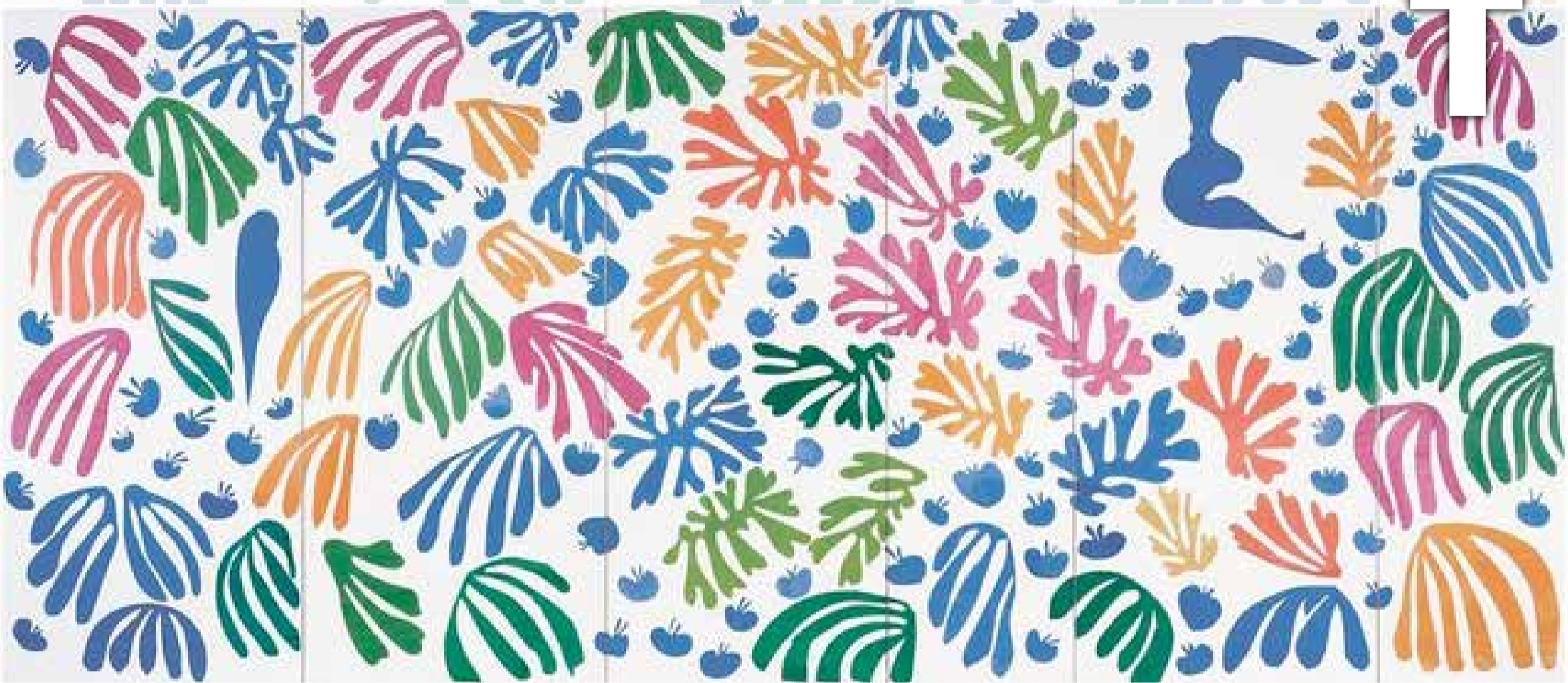
Il Pappagallo e la Sirena di Matisse, 1952 - 1953. Guazzo, collage su carta su tela, cm. 337 x 768,5. Collezione Stedelijk Museum, Amsterdam.